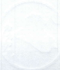
Mohammed AL - Halboosi Speaker of the Iraqi Council of Representatives Baghdad - August 2023