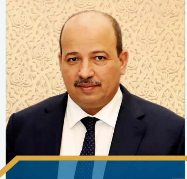
معالي السيد النعم ميارة رئيس مجلس المستشارين