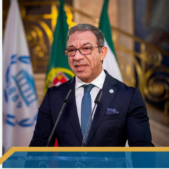
معالي السيد دوارتي باتشيكو رئيس الاتحاد البرلماني الدولي