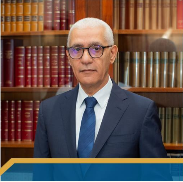
معالي السيد راشيد الطالبي العلمي رئيس مجلس النواب