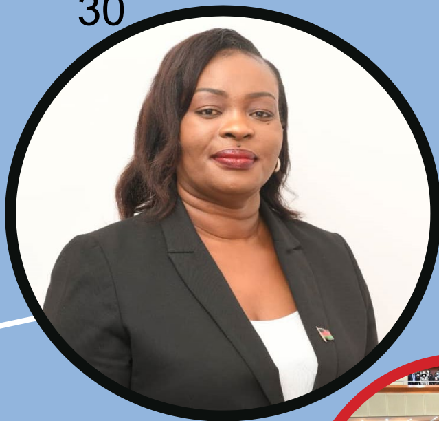
معالي السيدة كاثرين غوتاني هارة، عضوة في البرلمان رئيسة برلمان ملاوي