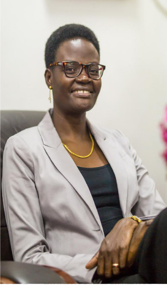
معالي الدكتورة توليا أكسون

إن معالي الدكتورة توليا أكسون هي شخص ديناميكي وملتزم، وسياسية مميزة، ومحامية رائعة، وأكاديمية متميزة، أظهرت تعثر مهارات القيادة طوال حياتها المهنية. وقبل أن تصبح رئيسة الجمعية الوطنية لجمهورية تنزانيا الاتحادية في شباط/فبراير 2022، المنصب الذي تشغله حتى الآن، شغلت معالي الدكتورة توليا منصب نائب رئيس البرلمان وكانت عضوة في البرلمان من العام 2015 إلى 2022. كما شغلت منصب نائب المدعي العام لجمهورية تنزانيا الاتحادية لفترة وجيزة في العام 2015. جاء تعيينها نائب للمدعي العام لجمهورية تنزانيا الاتحادية بعد مساهمتها البارزة كعضوة عينها الرئيس في الجمعية الدستورية في تنزانيا.